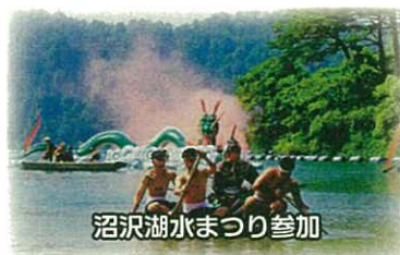
沼沢湖水まつり参加