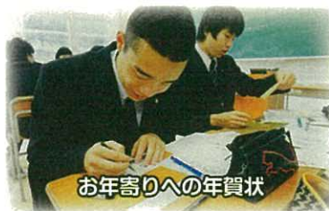
お年寄りへの年賀状